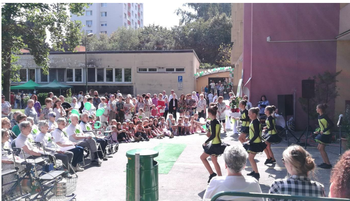
Deň otvorených dverí, 13.9.2018