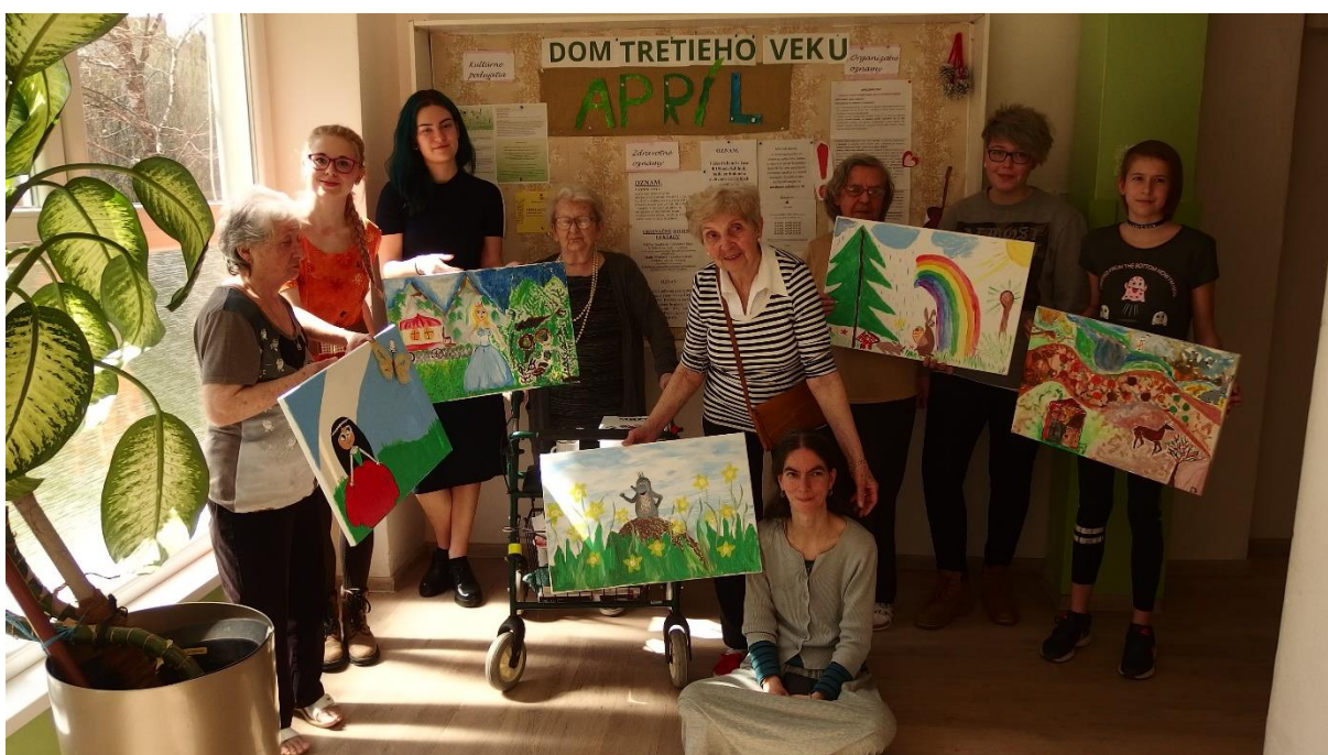
Medzigeneračný výtvarný projekt „Maľovaná cesta do rozprávky“, 9.4.2018 -11.4.2018