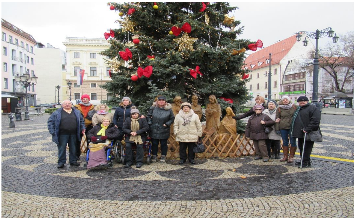
Vianočné trhy, 11.12.2018