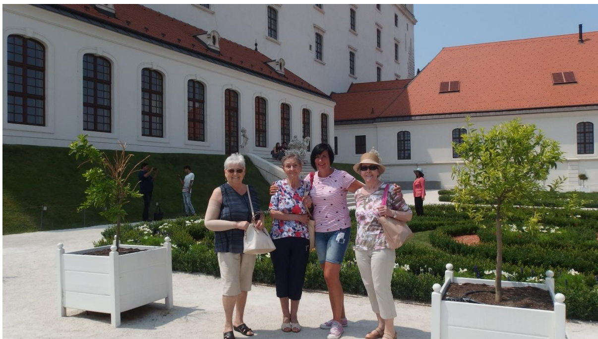
Výlet na Bratislavský hrad, 6.6.2018