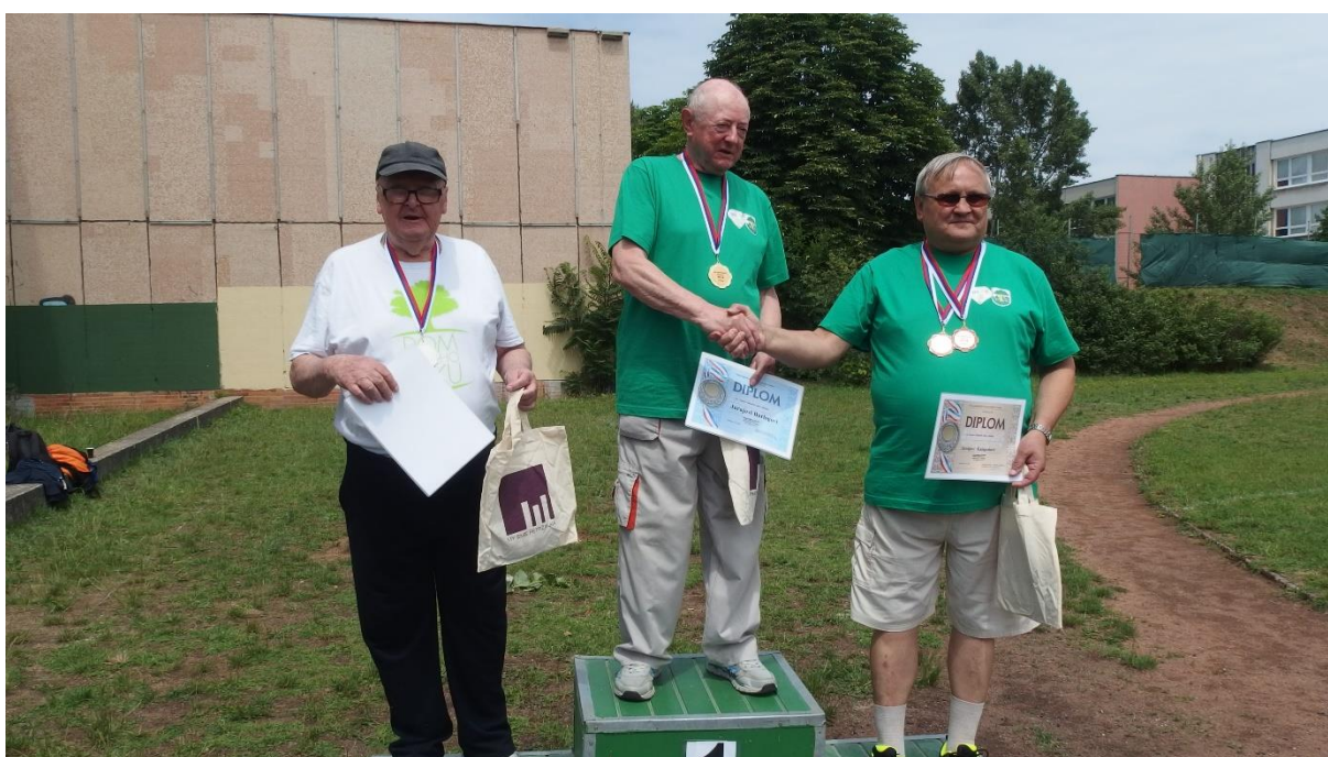
Športový deň seniorov, 15.6.2018