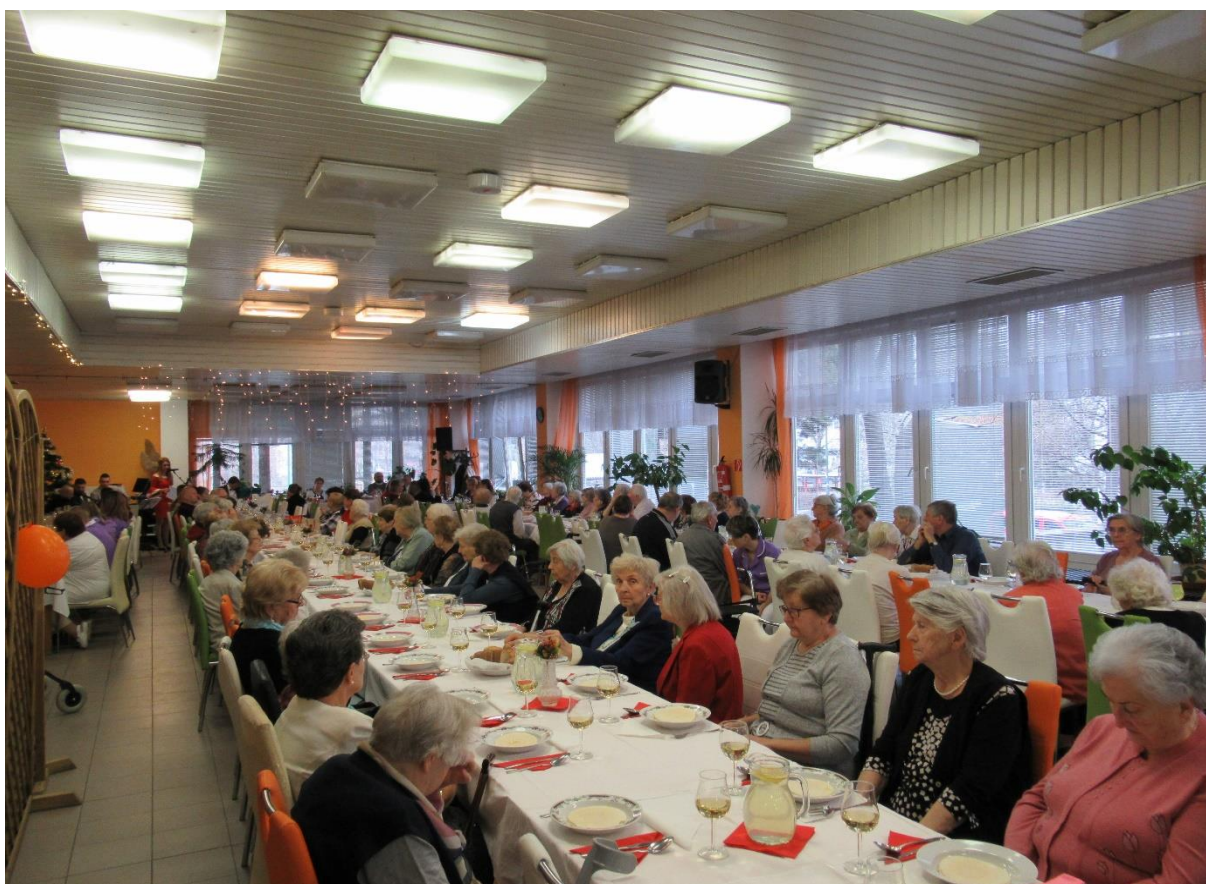
Vianočné posedenie pre klientov zariadenia Domu tretieho veku, 19.12.2018