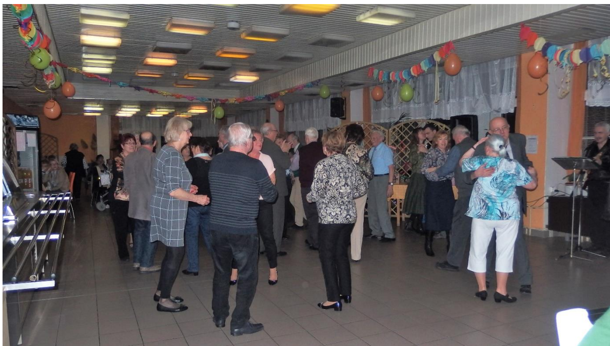
Fašiangová zábava, 7.2.2018