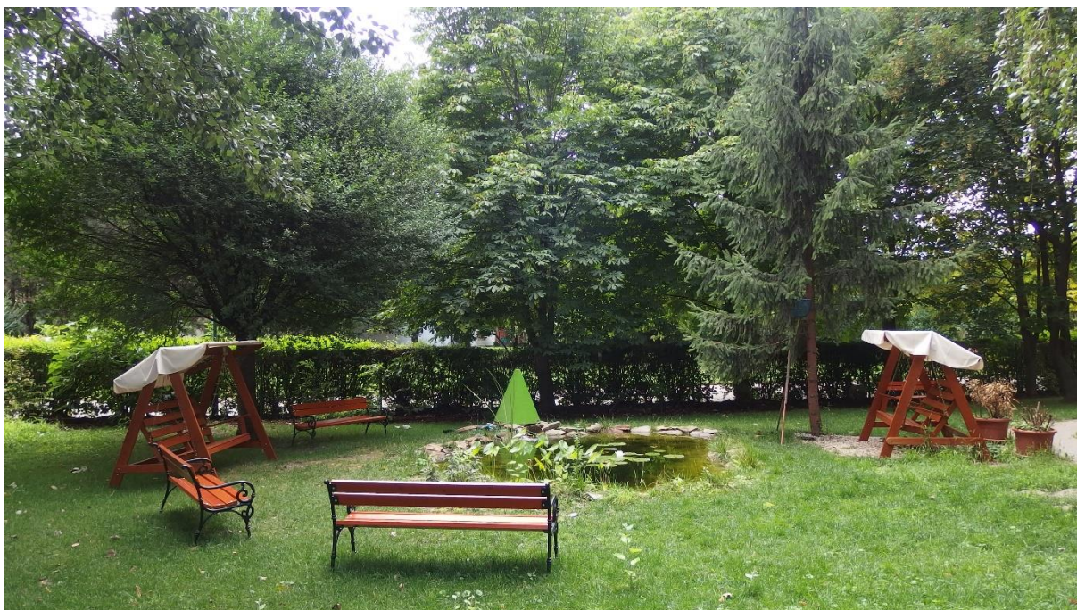
Oddychová zóna v areáli záhrady Domu tretieho veku